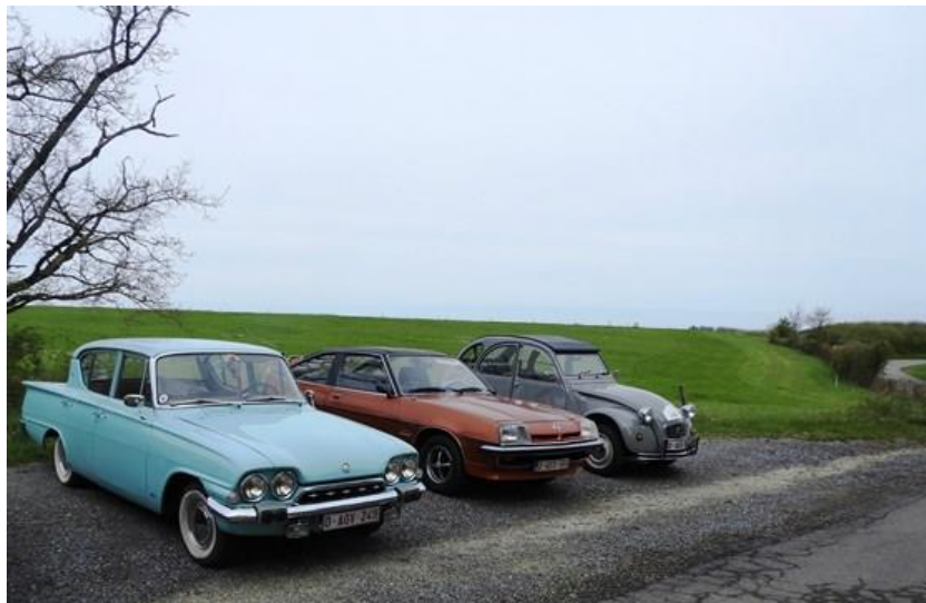
A gauche sur la photo, une rare CONSUL CAPRI de 1963